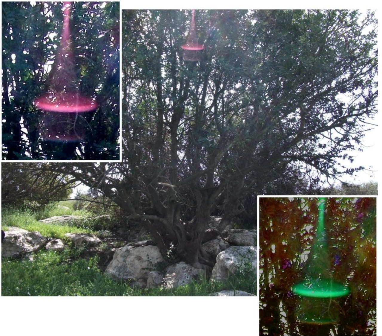
Figura 1 – La puerta de Sirius